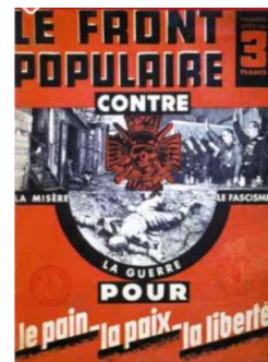
▲ Brochure du Front populaire, 1936.