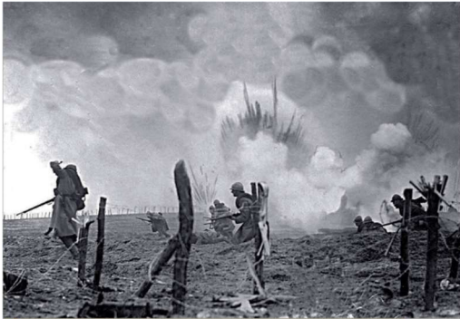
Photographie authentique, Verdun, 1916.

Se rendre sur le site : mescoursdhistoire.fr